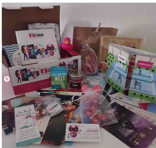
Abbildung 3+4: Lesezeichen und co.